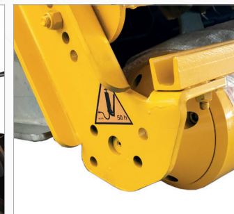
Mocowanie wału podporowego