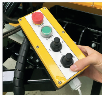
Komputer do sterowania