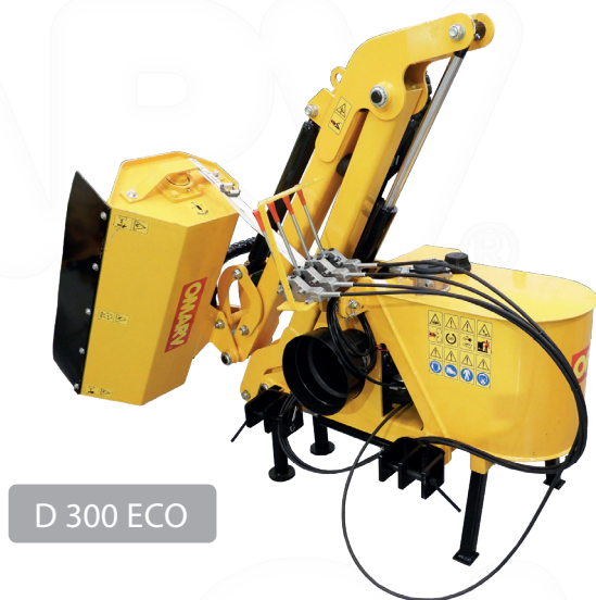
D 300 ECO