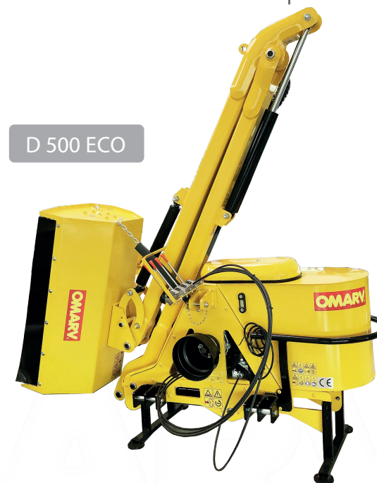
D 500 ECO