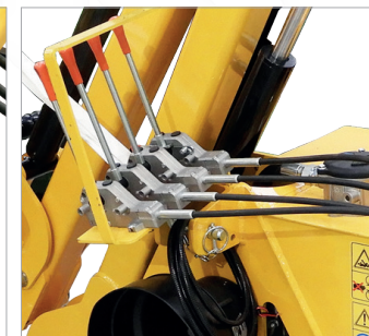
Sterowanie poprzez hydraulikę